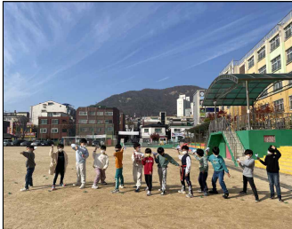
(1학년) 날아라 통일 비행기