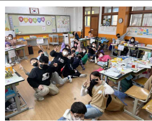
(4학년) 시장 놀이