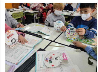
(3학년) 감정표현 돌림판