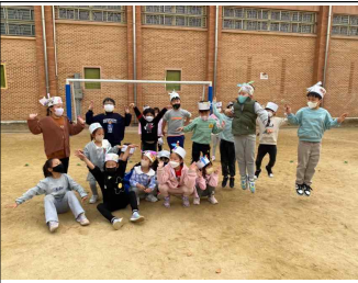
(1학년) 잠자리를 잡아라!