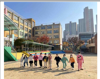
(2학년) 신나는 달리기