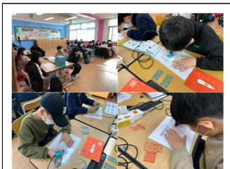
(5학년) 진로체험 (3D프린팅)