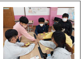
(5학년) 희망심기 활동