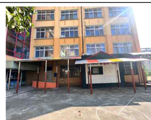
본관-강당 연결 차양막