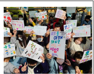
(3학년) 공감 시흥 공모전