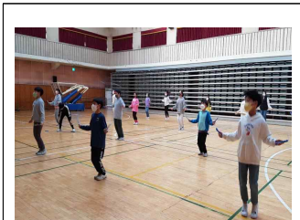
(4학년) 음악 줄넘기